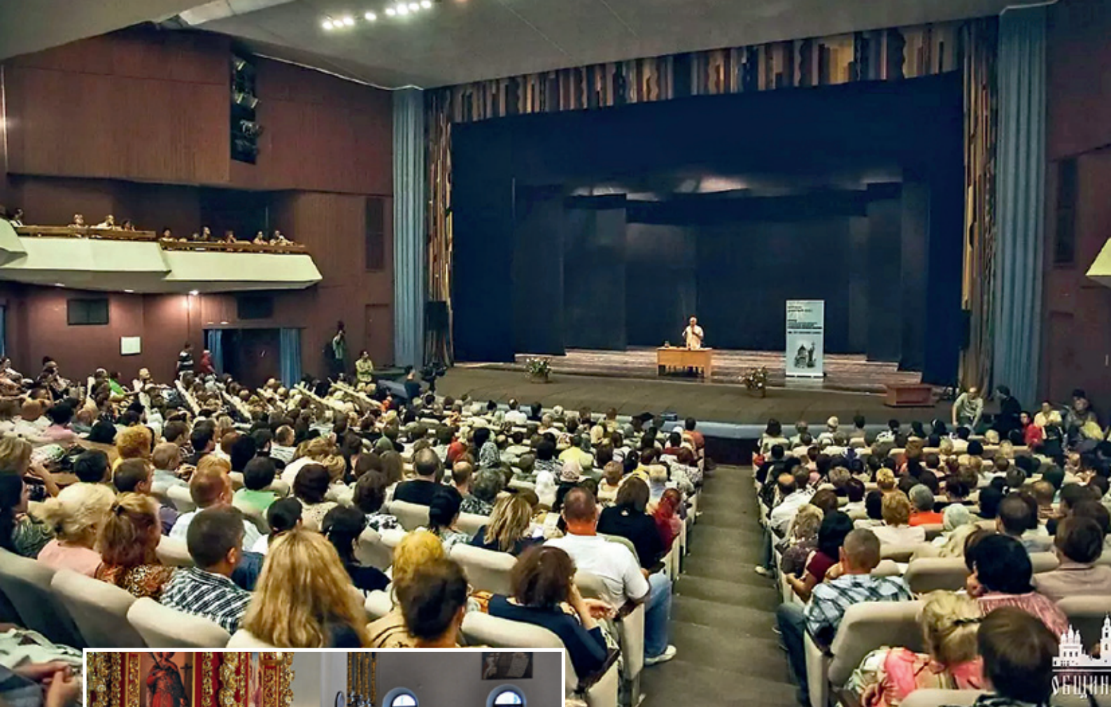
Публичные лекции А. И. Осипова неизменно собирают множество слушателей. ▲ ДК «Аркадия», Астрахань, 2015. Фото alexey-osipov.ru ◀ Александро-Невский храм в Подмоскowie, 2019. Фото alexey-osipov.ru