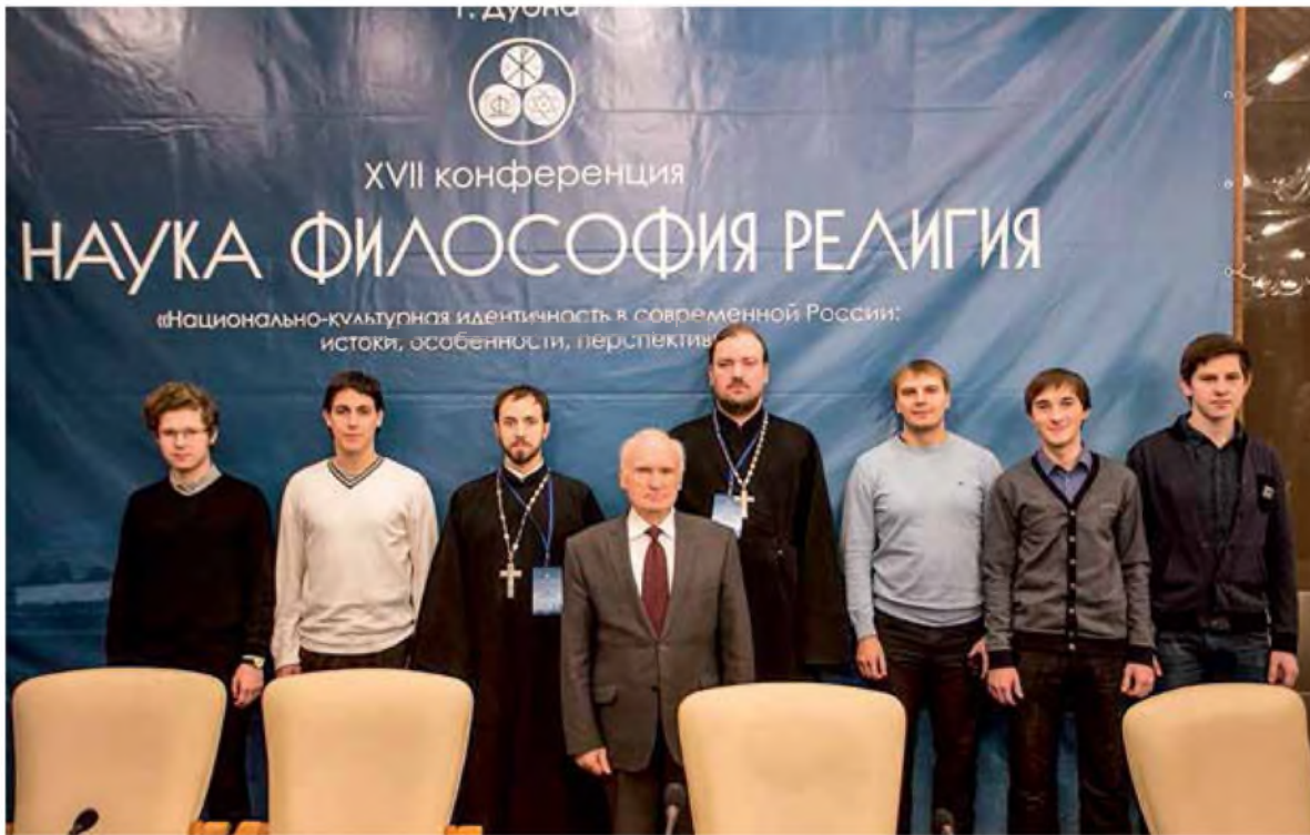
На XVII ежегодной конференции «Наука. Философия. Религия». 25–26 ноября 2014 г.

часто не зная друг друга, согласно утверждают одно и то же, то совершенно ясно, что здесь говорит уже не просто ум, эрудиция человека, не его домыслы, а голос Святого Духа. Да, и такими вопросами, как правило, являлись самые основные: вероучительные и аскетические. Это хорошо выражено в основополагающем правиле: In necessariis unitas, in dubiis libertas, in omnibus charitas («В главном — единство, во второстепенном — свобода, во всем — любовь»). Такое согласие отцов действительно — основа истинного богословия.