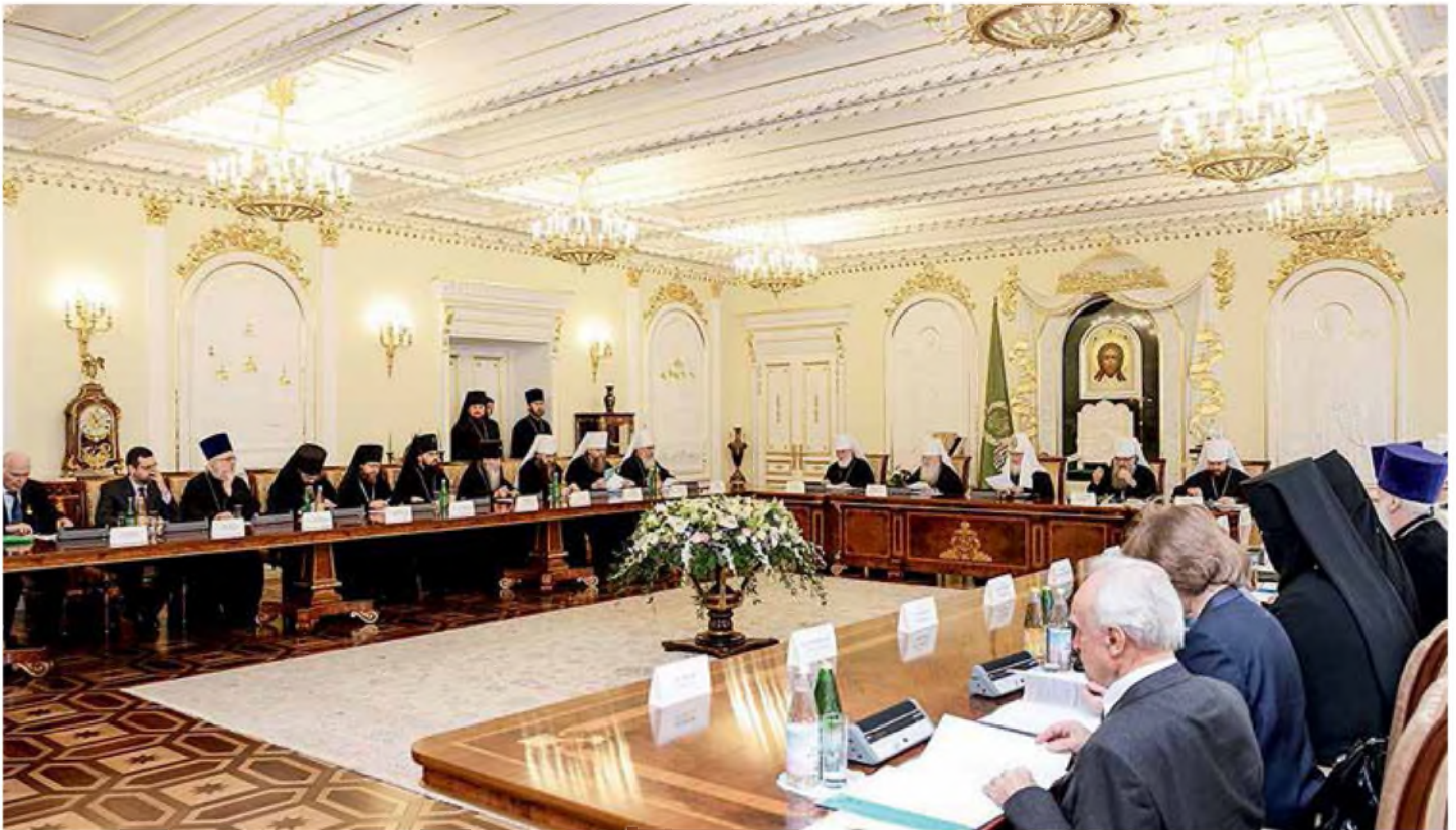
Заседание президиума Межсоборного присутствия Русской Православной Церкви 28 января 2015 г.

обещание исполнения крещальных обетов. Ибо крещение без твердого намерения изменить свою жизнь не принесет человеку пользы, и ему, как и крестным, придется за это отвечать перед Богом.